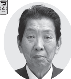
はし 端 まさし 端 雅